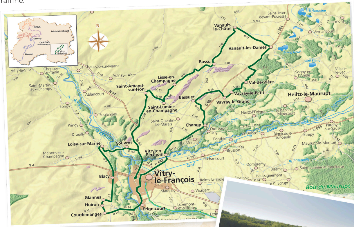
Reproduction interdite - numéro d'autorisation 1221-51/VF/04-20.

Cet itinéraire de 80km sillonne des petites routes à travers collines, monts et plaines ainsi qu'une vingtaine de villages à l'architecture caractéristique du Bocage champenois. C'est surtout une belle rencontre avec des vigneron passionnés friands de partager leur savoir ancestral et d'initier à la dégustation de ce vin raffiné.