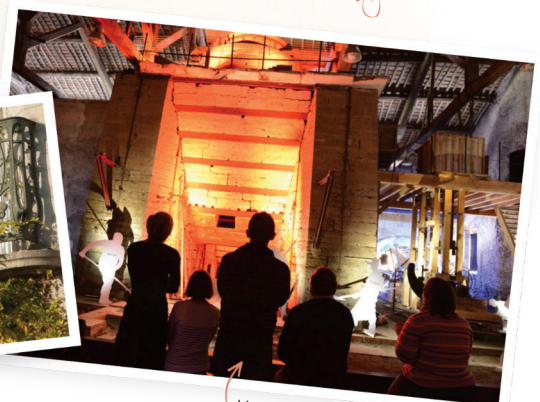
Metallurgic Park - Haut-Fourneau (XIX e )