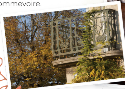
Balcon Art Nouveau signé Guimard (XX e )

Parmi les étapes incontournables de ses 75km «l'Art Nouveau» et la fonte 1900 à Saint-Dizier, le centre d'interprétation «Metallurgic Park» à Dommartin-le-Franc ou encore les fonds de modèles en plâtre du «Paradis» à Sommevoire.