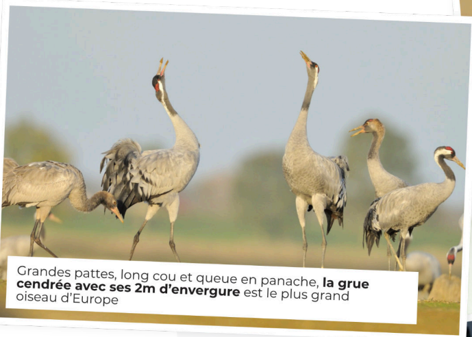
Grandes pattes, long cou et queue en panache, la grue cendrée avec ses 2m d'envergure est le plus grand oiseau d'Europe