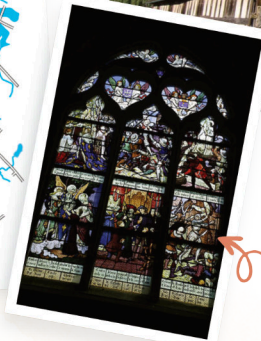
Eglise à Ceffonds Vitrail du XVI e «la Vie de Jeanne d'Arc»