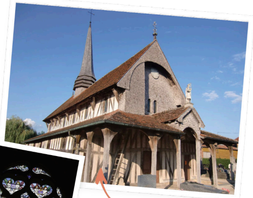
Eglise à Lentilles - Mélange subtil du pan de bois et vitraux Renaissance